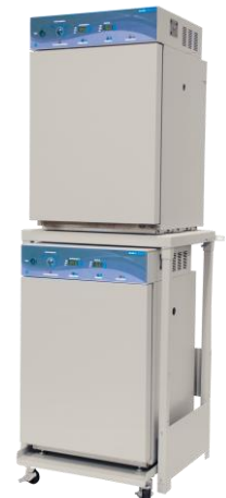
Luft- und Wassermantelte CO 2 -Inkubatoren

Kontaktieren Sie uns für Preise und detaillierte Informationen