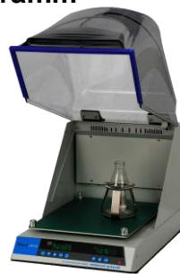
Schüttelinkubatoren Bench Top- und Bodenmodelle