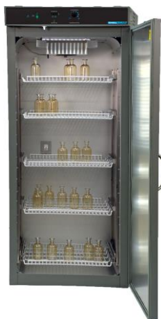
Drosophila- und Kühlinkubatoren