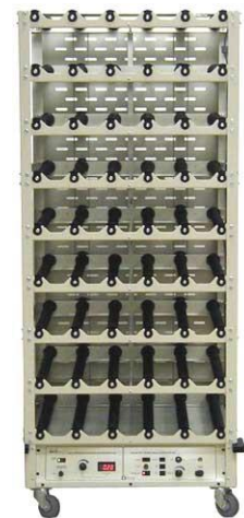
Basis und 8 Decks, mit Alarmsystem (Sci/ERA™)