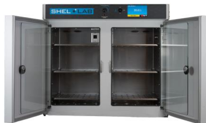
Standardinkubatoren mit 1 oder 2 Türen