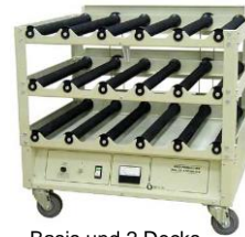
Basis und 2 Decks, Standardgerät