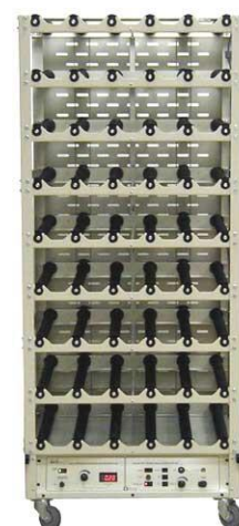
Basis und 8 Decks, mit Alarmsystem (Sci/ERA™)