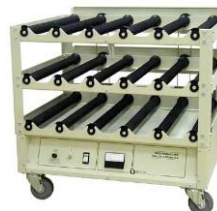
Basis und 2 Decks, Standardgerät